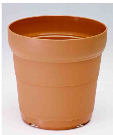
テラコッタ シリーズ