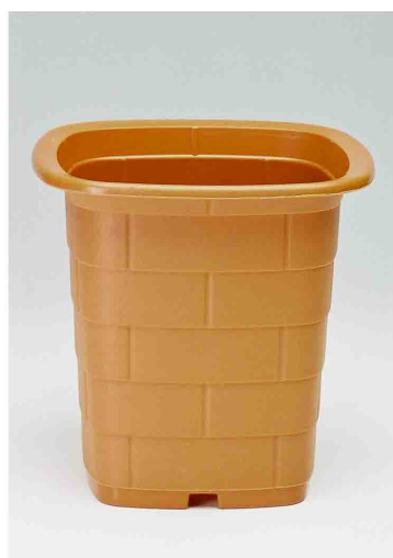
f タイル 5