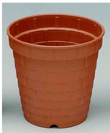
レンガポット シリーズ